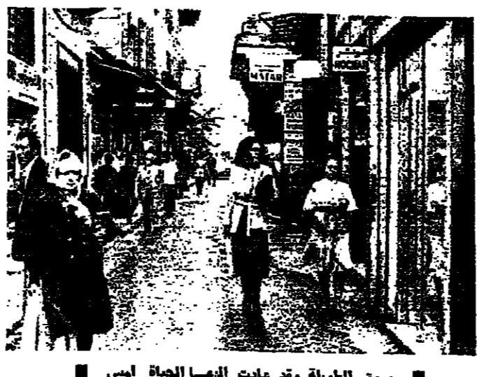
سوق الطويلة وقد عدت اليها الحياة امس

طلب وزير الصحة العلمية امس مجيد ارسلان من الدوائر المختصة في وزارته اجراء اعداد حول عدد الضحايا والجرحى الذين عولجوا في المستشفيات الحكومية والخاصة على نفقة الوزارة ، وذلك لمعرفة قيمة النفقات المترتبة على الوزارة تجاه المستشفيات الخاصة التي تعاونت معها ليعمل الى دفعها .